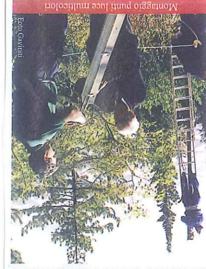
Montaggio punti luce multicolori