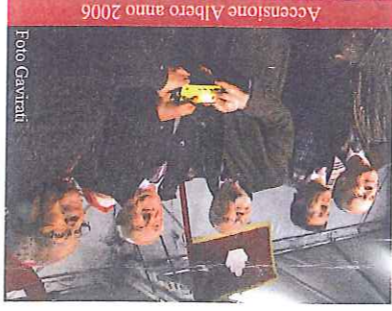
Accensione Albero anno 2006

L'Albero, pur con la sua imponenza riesce a sprigionare un'elegante armonia, e trasmettere ai nostri cuori quella virtù che nella quotidianità sono, a volte, silenziose: patienza, comprensione, gentilezza, tolleranza. Sentimenti forti che permettono agli uomini di perdonarsi, stringersi la mano e mantenere intatta la fiducia nel prossimo.