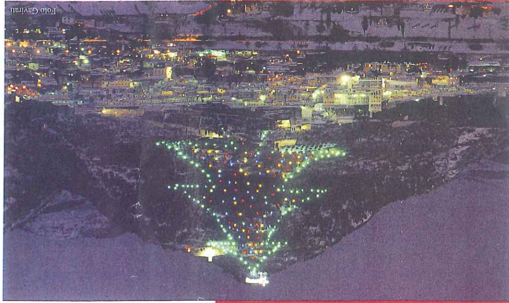
La Città di Gubbio e l'Albero di Natale più Grande del Mondo