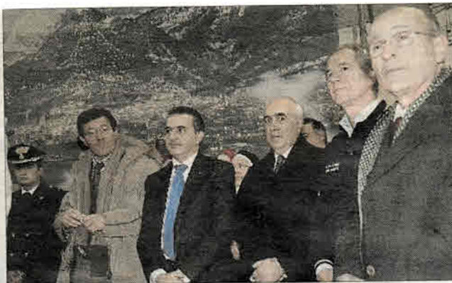
In prima fila sindaco, vescovo, balestrieri, sbandieratori e l'onorevole Girlanda