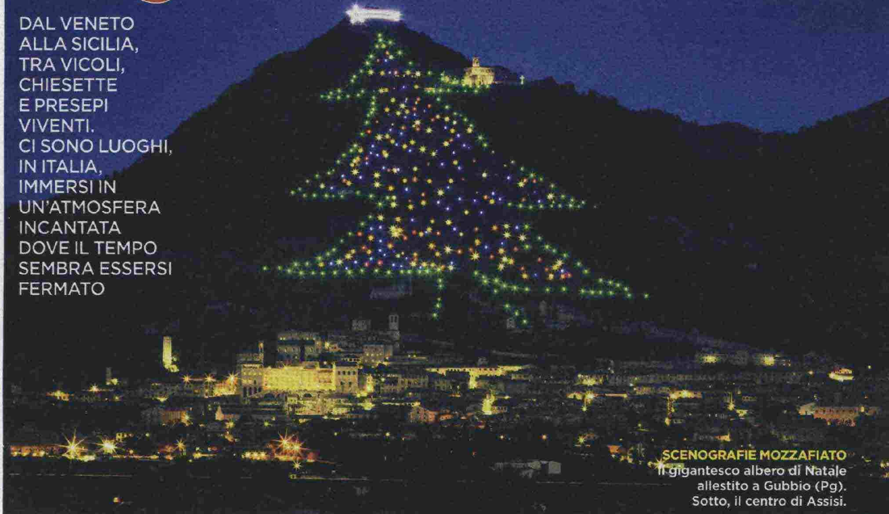
SCENOGRAFIE MOZZAFIATO Il gigantesco albero di Natale allestito a Gubbio (Pg). Sotto, il centro di Assisi.

DAL VENETO ALLA SICILIA, TRA VICOLI, CHIESETTE E PRESEPI VIVENTI. CI SONO LUOGHI, IN ITALIA, IMMERSI IN UN'ATMOSFERA INCANTATA DOVE IL TEMPO SEMBRA ESSERSI FERMATO